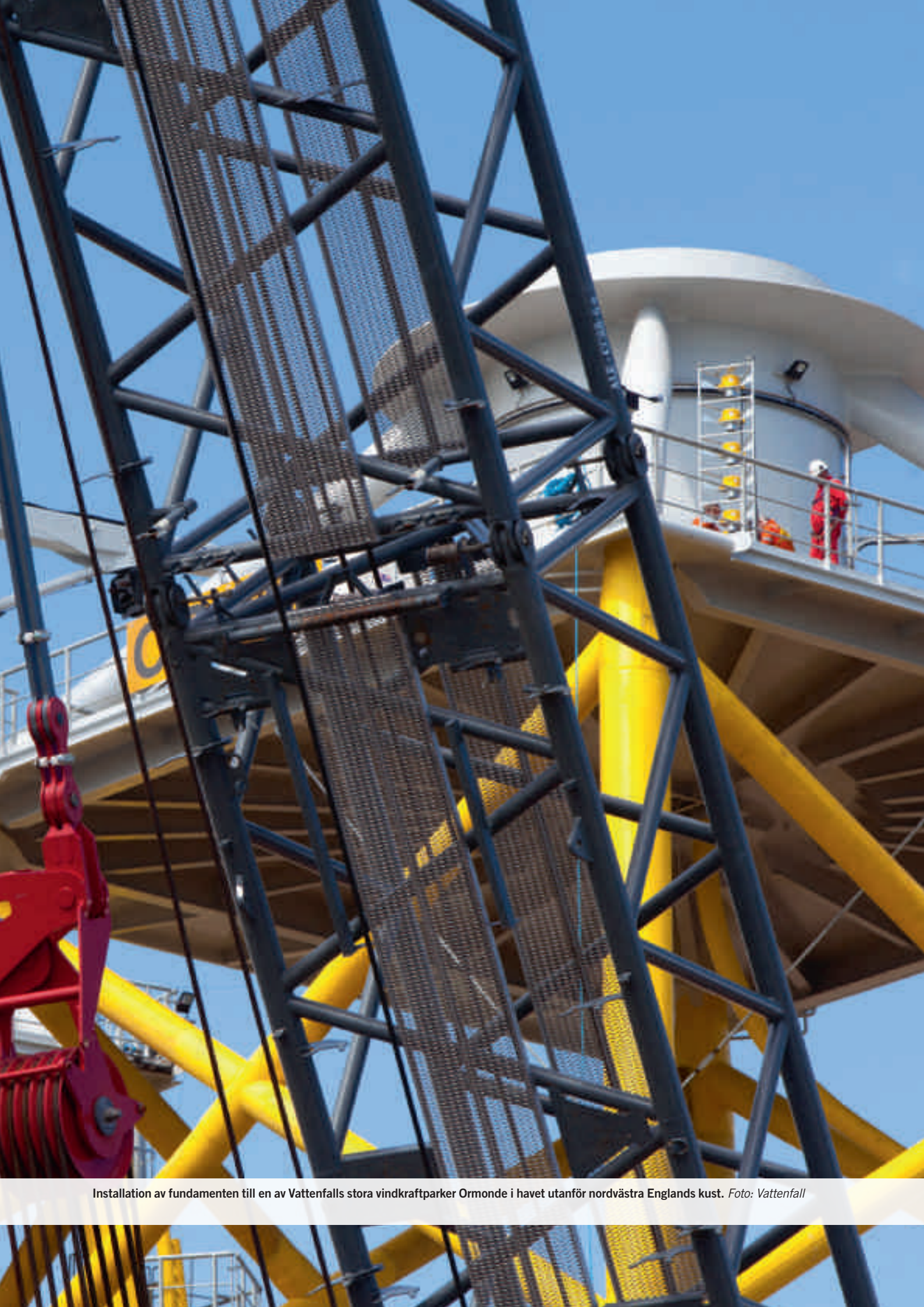
Installation av fundamenten till en av Vattenfalls stora vindkraftparker Ormonde i havet utanför nordvästra Englands kust.